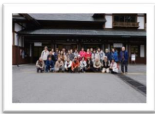
2018年4月 日光華厳・龍頭の滝、 日光東照宮 バスハイクより